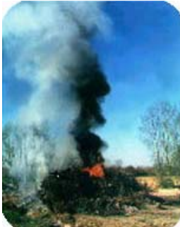
Le brûlage des déchets à l'air libre