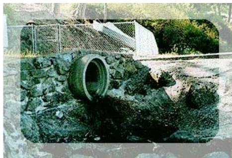
Les rejets polluants dans le milieu naturel