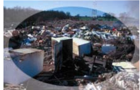
L'abandon de déchets dans les décharges sauvages